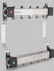
з регулюючими вентиллями - серія UVN