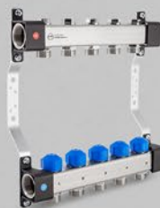
з регулюючими вентиллями і вентиллями сервоприводів - серія UVS