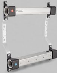
з внутрішньою різьбою 1/2" - серія RBB