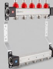
з витратомірами - серія UFN