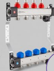
з витратомірами 2,5 л/хв або 5 л/хв (max) і вентиллями для сервоприводів, а також з повітрявипускною секцією - серія UFST або серія UFST max