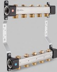
з ніпелями 3/4" і запірними вентиллями - серія RVV