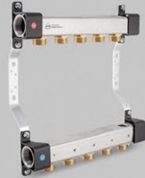
з ніпелями 3/4" - серія RNN