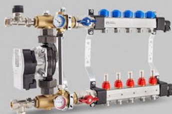
з витратомірами і вентиллями для сервоприводів, а також зі змішувальною системою з електронним насосом - серія USFP