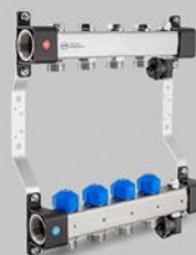
з регулюючими вентиллями і вентиллями сервоприводів, а також повітрявипускною секцією - серія UVST