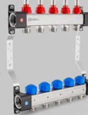
з витратомірами і вентиллями для сервоприводів - серія UFS